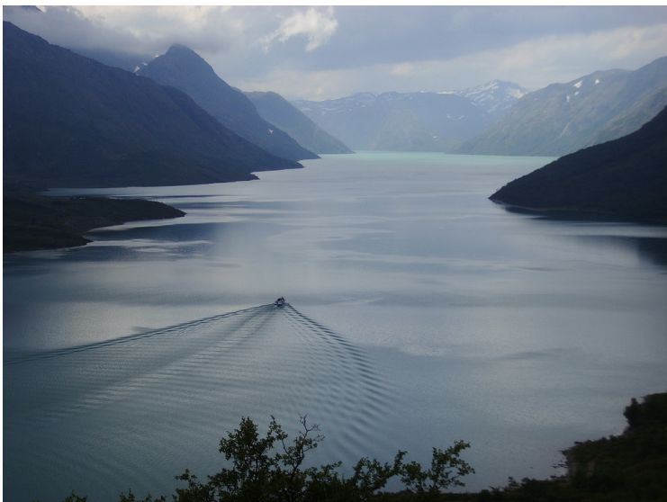
„Abendstimmung“ Udo Fürderer