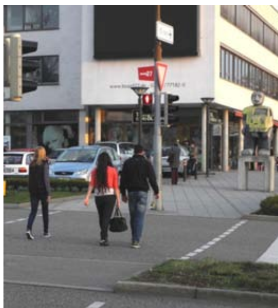
Springt die Ampel auf „Rot“, zügig weitergehen