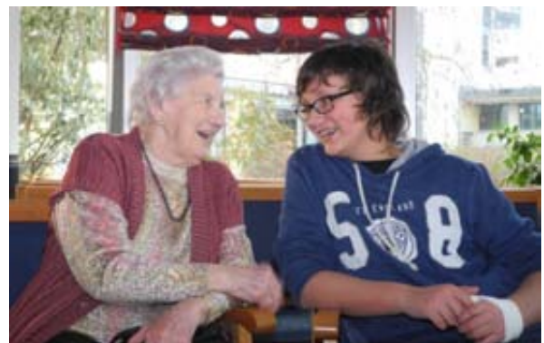
Alt und Jung, sie können gut miteinander

Die Senioren berichteten über ihre Erfahrungen, über die Aktivitäten, die sie gemeinsam unternehmen und wie sie dieses Gemeinsame von Jung und Alt erleben.