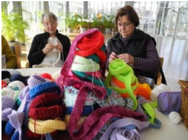
Die KreAktiven bei den Vorbereitungen, sie stricken und stricken meterweise für eine spektakuläre Aktion

Die Vorbereitungen sind bereits angelaufen. Nicht nur die aktiven Gruppen werden sich vorstellen, sondern es werden auch viele andere interessante Aktivitäten gezeigt und durchgeführt.